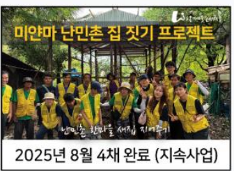
미안마 난민촌 집 짓기 프로젝트 2025년 8월 4채 완료 (지속사업)