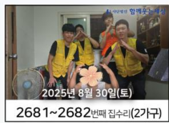
2025년 8월 30일(토) 2681~2682번째 집수리(2가구)

9월 6일, 구로구의 14가구(집수리 8가구 + 단손수리 6가구)를 위해 고려대, 시립대, 광운대, 고려대 OB, 덕성여대 학생들과 함께웃는세상 봉사팀장 등 29명의 봉사자들이 모였습니다.