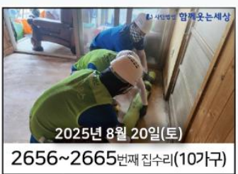
2025년 8월 20일(토) 2656~2665번째 집수리(10가구)