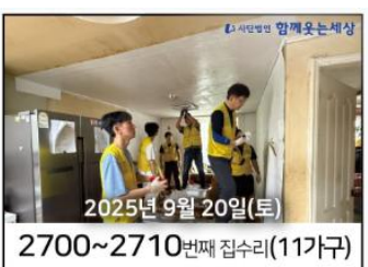
2025년 9월 20일(토) 2700~2710번째 집수리(11가구)

9월 27일 이날 활동에는 한양대, 중앙대, 호서대, 쿠팡, 따뜻한세상, 서울대 봉사팀과 함께웃는 세상 봉사팀장 등 총 67명의 봉사자가 참여했습니다. 봉사자들은 도배와 장판 교체, LED등 설치, 청소와 정리 등.