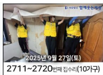
2025년 9월 27일(토) 2711~2720번째 집수리(10가구)