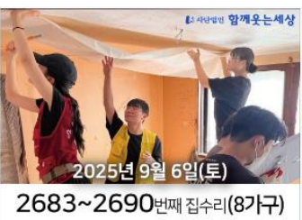
2025년 9월 6일(토) 2683~2690번째 집수리(8가구)

9월 13일, 구로구에서 15가구(집수리 9가구 + 단손수리 6가구)를 위해 꼬꼬봉, 연세대OB, 연세대, 홍익대, 이화여대OB 학생들과 개인 자원봉사자, 함께웃는세상 봉사팀등 42명의 마음이 한자리에 모였습니다.