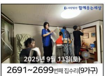
2025년 9월 13일(토) 2691~2699번째 집수리(9가구)