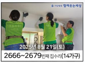
2025년 8월 21일(토) 2666~2679번째 집수리(14가구)